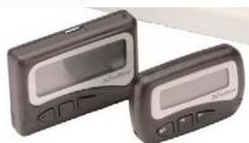
RECHERCHE DE PERSONNE (BIP)