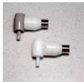
FICHE DE REMPLACEMENT O