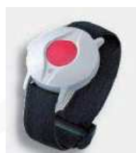
APPEL MALADE RADIO MALADEADIO