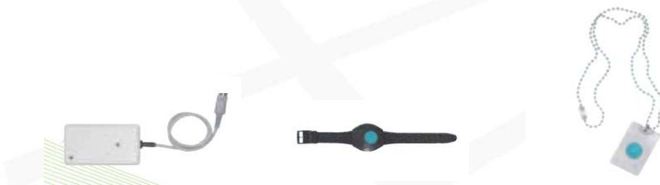
RECEPTEUR 73310 E1