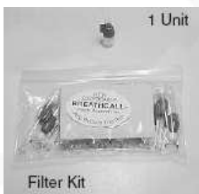
EMBOUT FILTRE (P. au souffle)