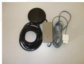
CONTACTEUR PRO-7T 57