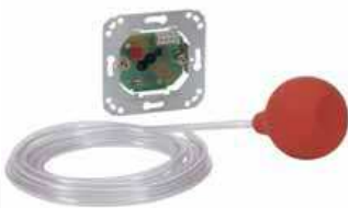
BLOC D'APPEL 70006