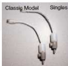
FICHE DE REMPLACEMENT F