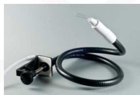
POIRE AU SOUFFLE