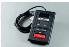
APPEL A LA VOIX