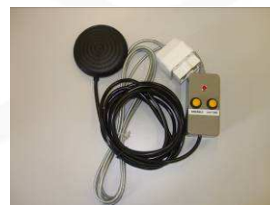
CONTACTEUR PRO-7T 57/2 AVEC TELECOMMANDE ECLAIRAGE