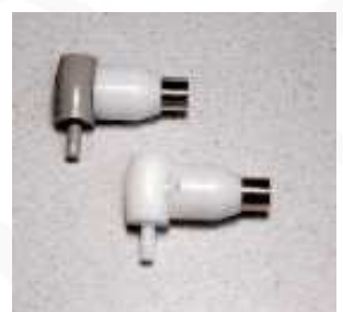
FICHE DE REMPLACEMENT O