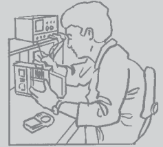
Le service technique