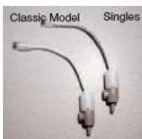
FICHE DE REMPLACEMENT F