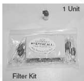
EMBOUT FILTRE (P. au souffle)