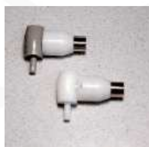
FICHE DE REMPLACEMENT O