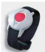
APPEL MALADE RADIO