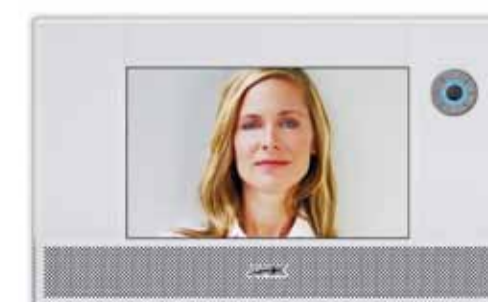
En route vers l'habitation du futur : le poste intérieur de la communication de porte est formé par les panneaux de commande (photos : écrans Crestron et AMX).