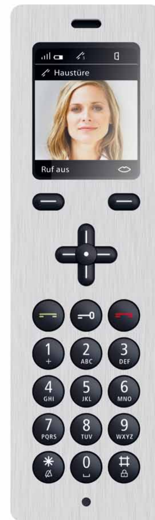
Siedle Scope Acier inoxydable brossé