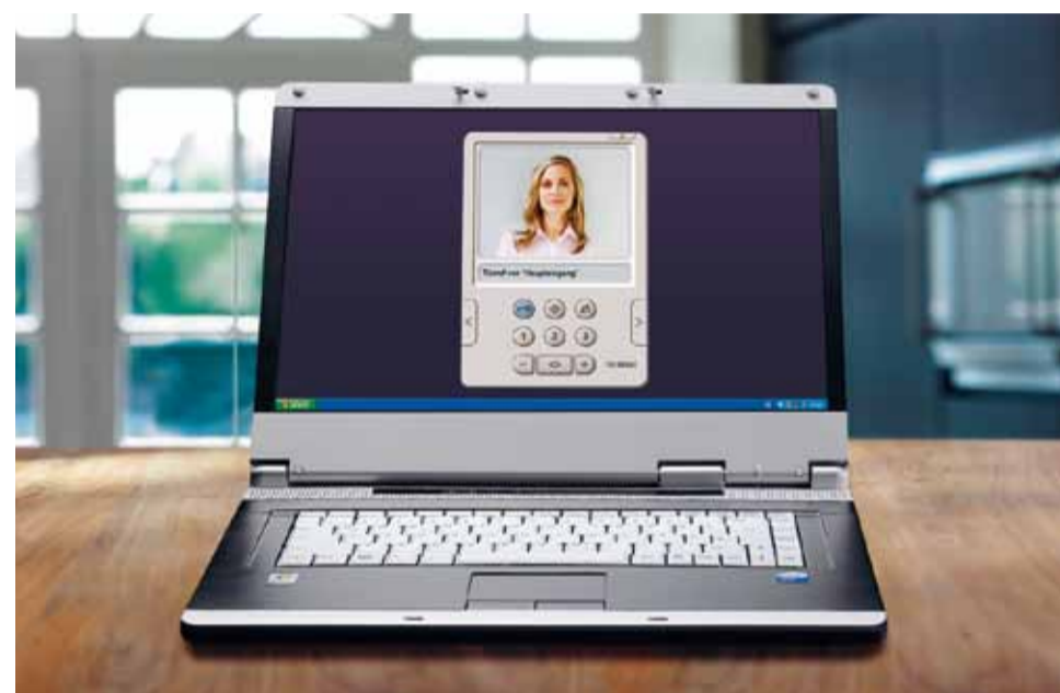
Siedle DoorCom-IP : la liaison entre la porte et le PC

Imaginez : la platine de rue est reliée à votre réseau IP. Les signaux d'appel, vocaux et vidéo de la porte sont transmis dans le réseau à un logiciel client. Le PC gère toutes les fonctions d'un combiné intérieur, y compris la présentation vidéo, le dispositif d'ouverture de porte, les fonctions de commande et les messages d'état. Les combinés intérieurs supplémentaires ne sont plus nécessaires mais peuvent être utilisés à tout moment, grâce à DoorCom-IP, une interface entre le réseau de données et la technique de porte, flexible et modulable.