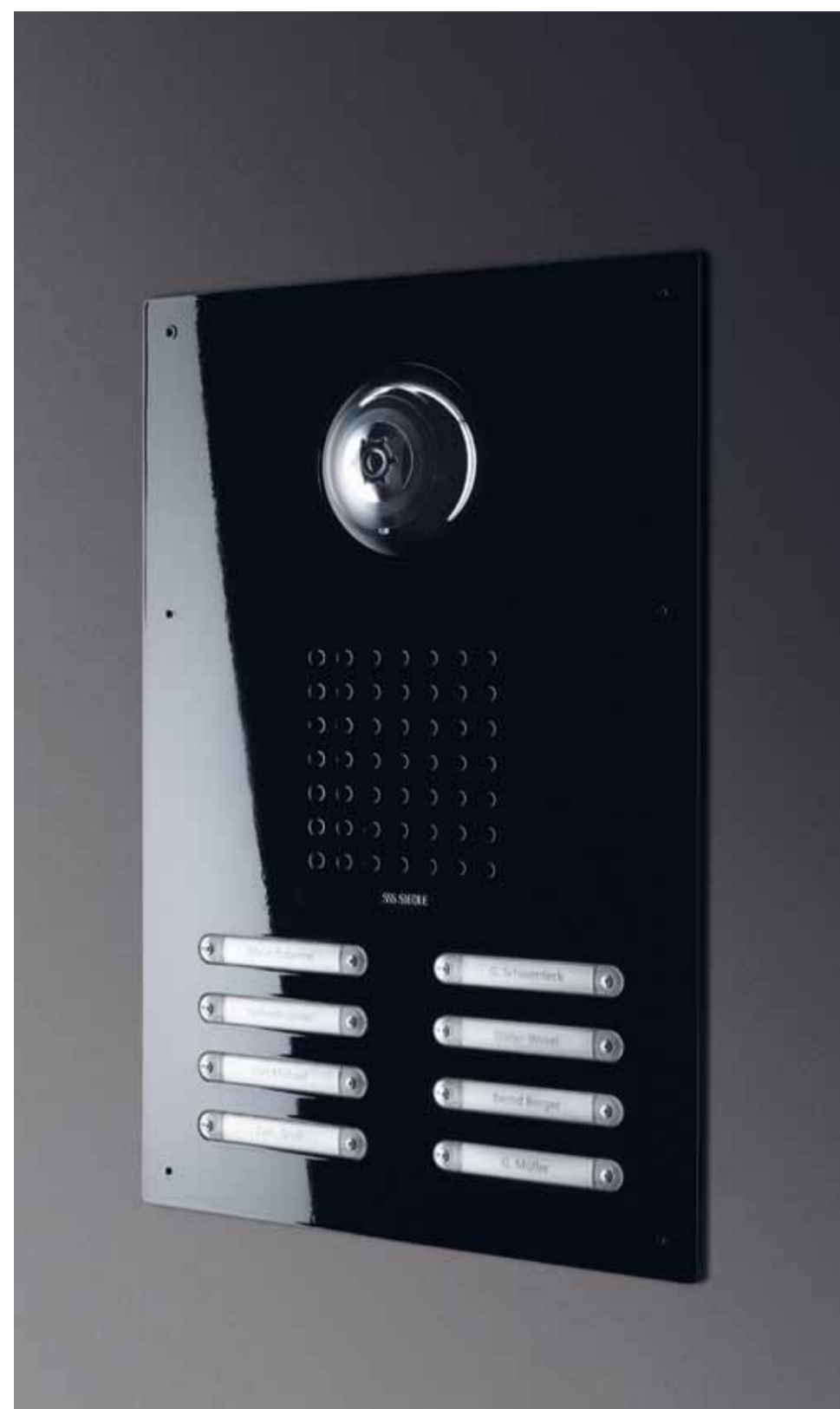
Platine de rue vidéo en noir brillant.

Spécialement conçu pour remplacer les platines de rue de la série TL 111 : une variante de la ligne de produits Siedle Classic actuelle.