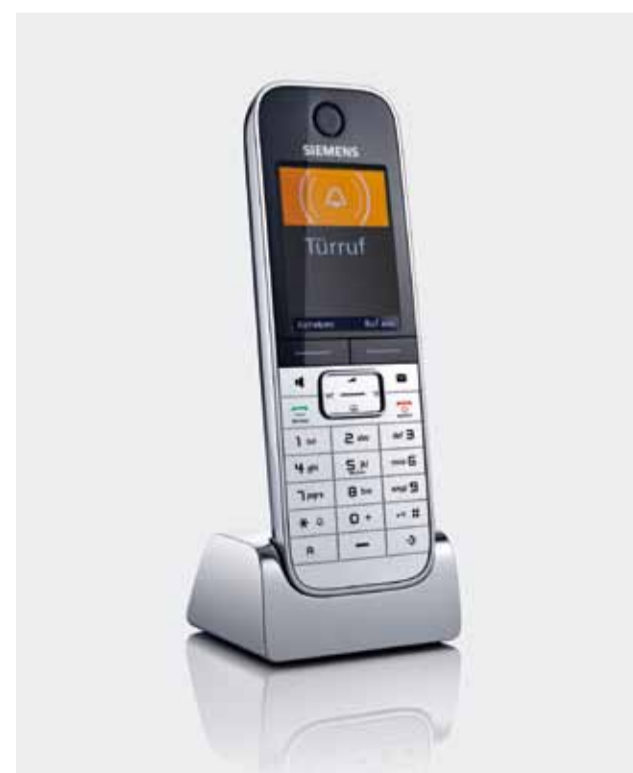
Siedle DoorCom : la liaison entre la porte et le téléphone

Plus d'informations sur www.siedle.fr/telephone