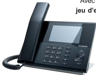
IP232 – Technique sophistiquée et design primé