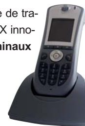
Téléphone Wifi innovaphone IP62

Même si vous avez opté pour la variante hardware la plus petite, le PBX innovaphone accompagne votre entreprise dans sa croissance et est modulable et évolutif à l'infini . Un nombre presque illimité d'utilisateurs et de sites peuvent être connectés.