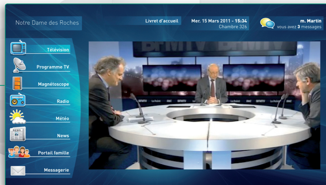
Accueil menu commun